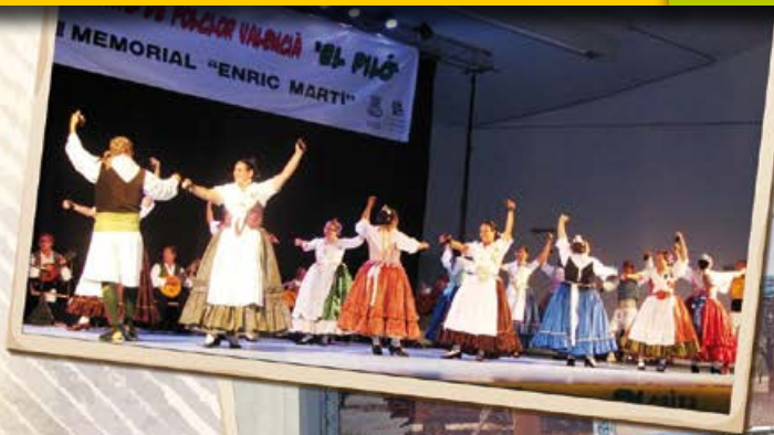
Grup de Danses "El piló" de Burjassot