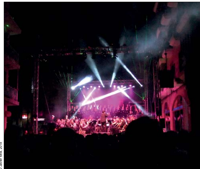
Concierto de verano de la Agrupació Musical «La Nova» (2018)

23:00 h , en el parque municipal de Villa Rosario, CONCIERTO DE VERANO de la Agrupació Musical LA NOVA .