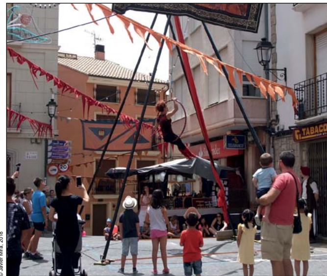
Espectáculo en la feria medieval (2018)

22:00 h , CENA de sobaquillo en el patio de la Malena, con la actuación de HEY YOU .