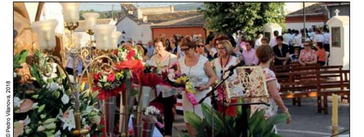
Ofrenda de flores (2018)

20:30 h , volteo general de campanas. A continuación, en la plaza de la Malena, TARDE DE BAILES POPULARES . Se bailarán todos los bailes tradicionales del pueblo: el Fandango, la Jota, el U, el Copeo... De participación abierta a todo aquel que quiera bailar de paisano. Con la colaboración de la Rondalla del Grupo AIRES DE MARIOLA .