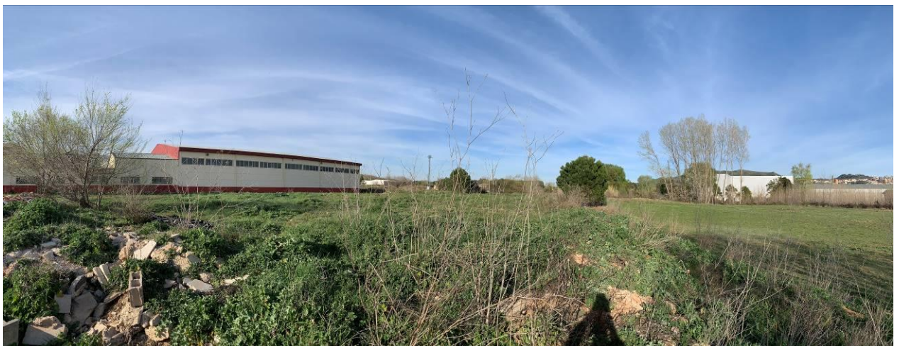
Vistas generales de la zona de actuaci3n